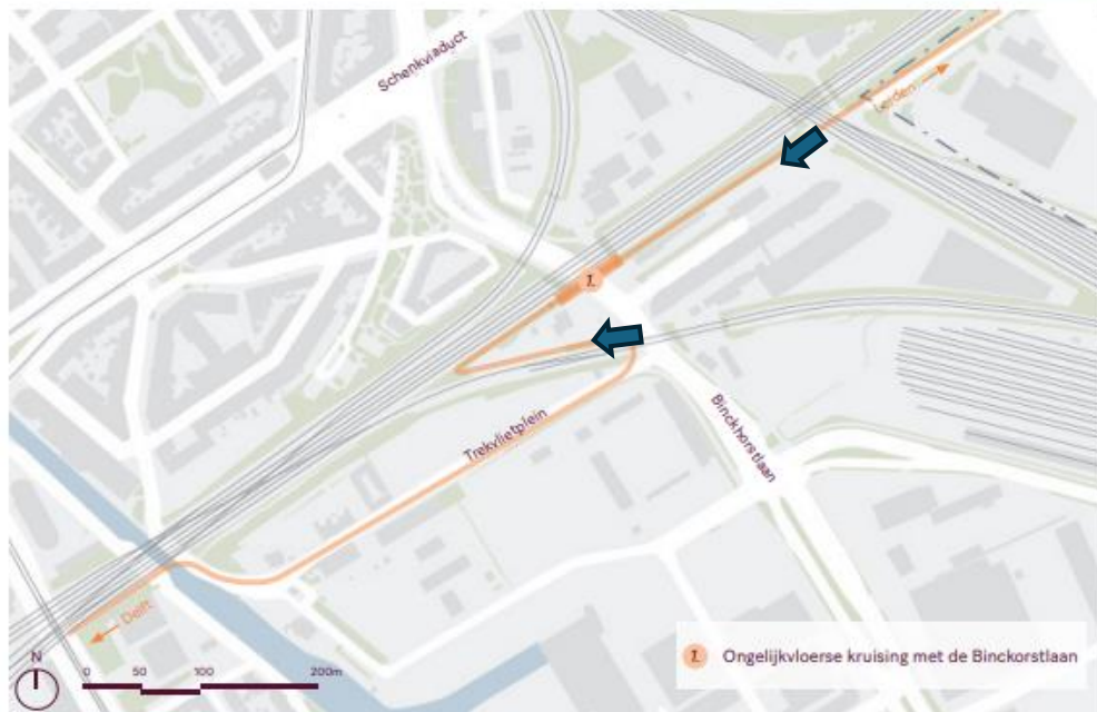
Locatie van de maatregel zoom-in

Dit deel van de velostrade is een verlenging van de in het no-regret opgenomen Velostrada tussen Laan van NOI en de Binckhorstlaan.