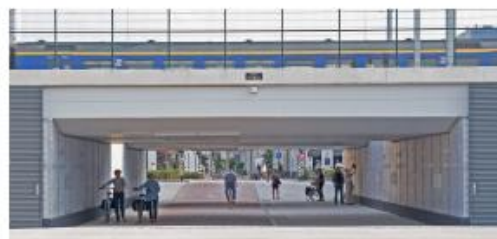
Referentiebeeld spoorpassage, Tilburg