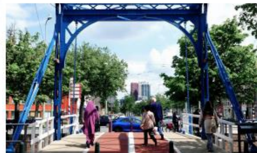
Referentiebeeld stremming autoverkeer, Den Haag