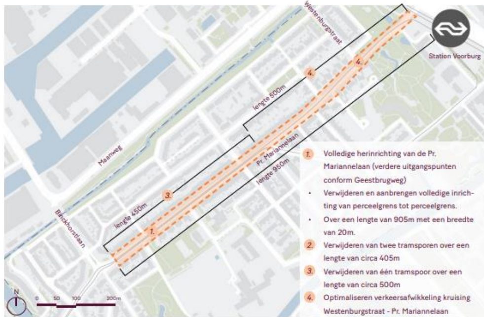
Locatie van de maatregel zoom-in

De herinrichting van het wegprofiel zorgt ook voor een verbetering van de fietsroute tussen de Binckhorst en Rijswijk. Deze route is belangrijk voor met name schoolgaande jeugd. De verkeersveiligheid van deze route laat echter veel te wensen over. Met een in de toekomst intensiever gebruik van deze route zijn er maatregelen nodig die verder reiken dan alleen het tracé van de tram. Het beperken van het doorgaande verkeer heeft een positief effect op de aantrekkelijkheid van het gebruik van de fiets en OV ten opzichte van de auto in de Binckhorst.