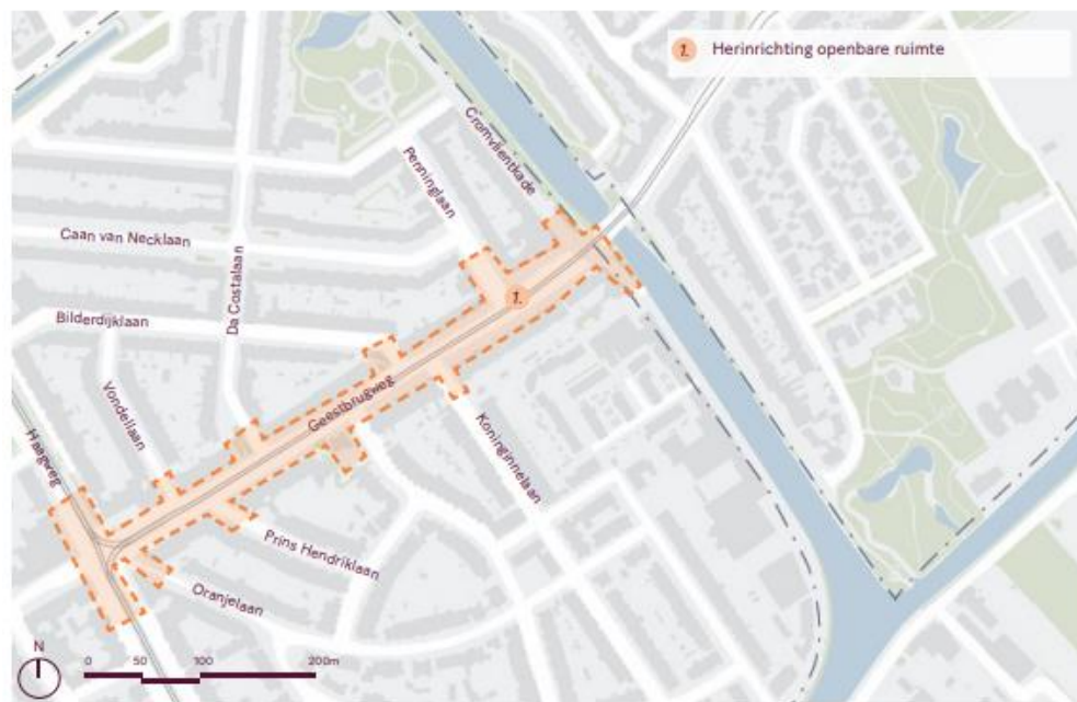
Locatie van de maatregel zoom-in

De herinrichting van het wegprofiel, wat vooral een lokaal leefbaarheidseffect heeft, brengt ook een verbetering van de fietsroute tussen de Binckhorst en Rijswijk teweeg. Het beperken van het doorgaande verkeer heeft een positief effect op de aantrekkelijkheid van het gebruik van de fiets en OV ten opzichte van de auto in de Binckhorst.