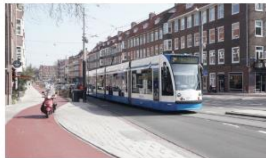
Referentiebeeld straat met tram en vrijliggend fietspad, Amsterdam