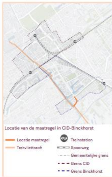
Locatie van de maatregel in CID-Binckhorst

Binnen het pakket bestaat de maatregel uit het verbeteren van de fietsinfrastructuur tussen de Maanweg en het trekvluetracé (Hoekweg), met fietsvoorzieningen en veilige kruisingen op de Pr. Mariannelaan. Aanvullend hierop voorziet deze maatregel in een integrale herinrichting van de Pr. Mariannelaan en Binckhorstlaan in Voorburg, om de verkeersveiligheid te vergroten en de kwaliteit van langzaam verkeersvoorzieningen te verbeteren. Tevens worden hiermee groenstructuren versterkt. Deze maatregel sluit aan op maatregel 16 'Herinrichting Prinses Mariannelaan'.