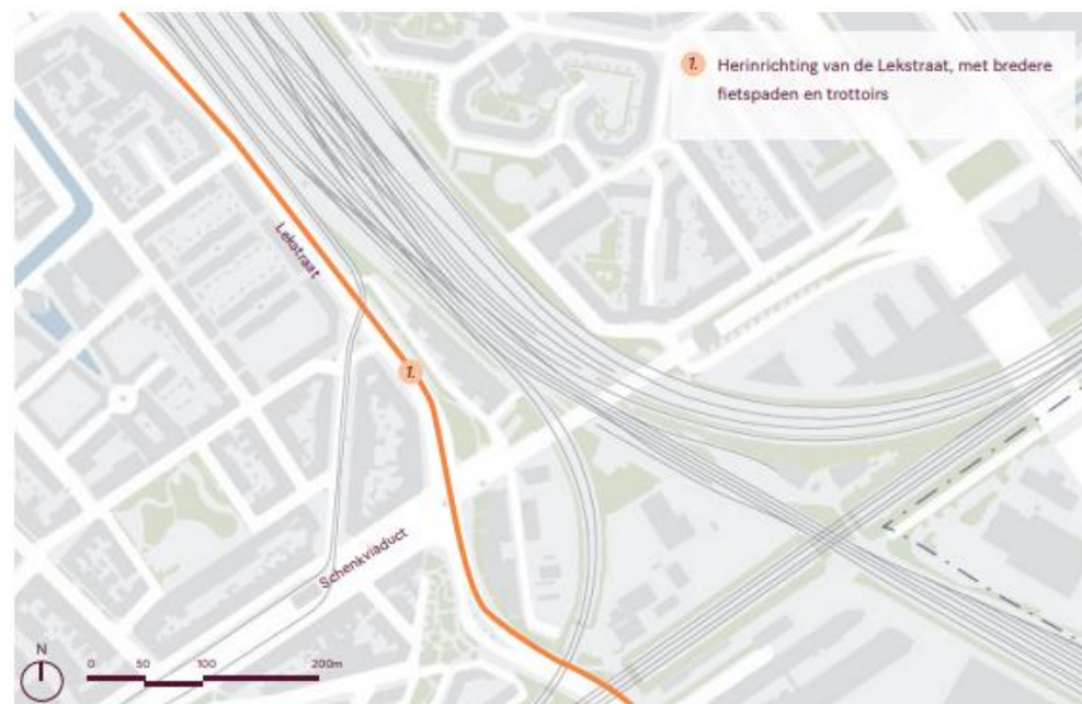
Locatie van de maatregel zoom-in

In de Binckhorst zelf zijn de hoofd fietsroutes als fietspaden in twee richtingen uitgevoerd. Een heringerichte Lekstraat sluit hier goed op aan.