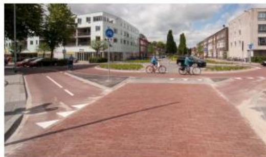
Referentiebeeld fietsstraat met veilige oversteek