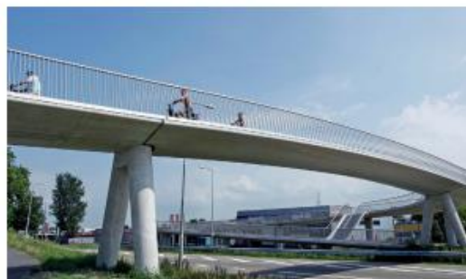
Referentiebeeld fietsbrug N242, Heerhugowaard