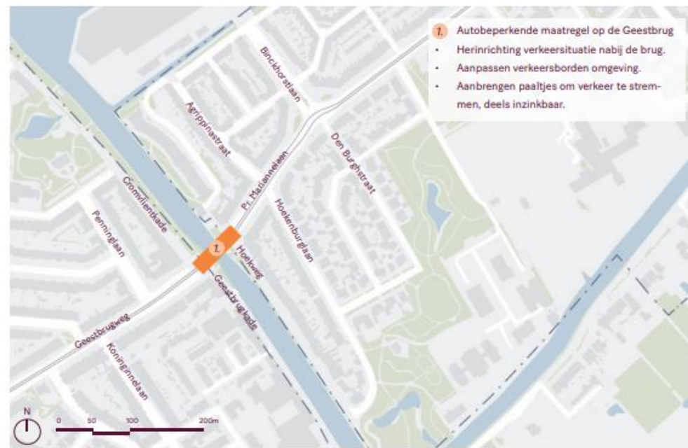
Locatie van de maatregel zoom-in

De herinrichting van het wegprofiel, wat vooral een lokaal leefbaarheidseffect heeft, brengt ook een verbetering van de fietsroute tussen de Binckhorst en Rijswijk teweeg. Het beperken van het doorgaande verkeer heeft een positief effect op de aantrekkelijkheid van het gebruik van de fiets en OV ten opzichte van de auto in de Binckhorst.