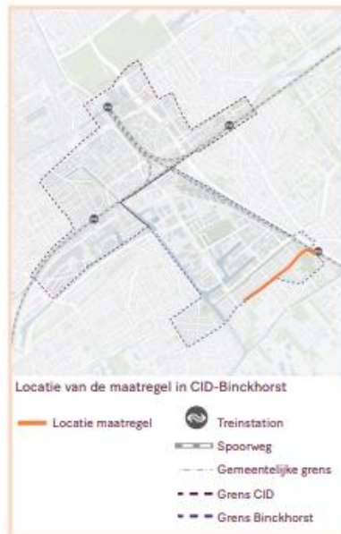
Locatie van de maatregel in CID-Binckhorst

Bij een integrale herinrichting van de Pr. Mariannelaan tussen station Voorburg en de kruising Pr. Mariannelaan en de Binckhorstlaan kan overwogen worden om de bestaande tramsporen te verwijderen. Als het verwijderen van de tramsporen bijdraagt aan een verdere optimalisatie van de inrichting van de Pr. Mariannelaan, moet over een lengte van circa 500m één tramspoor, en over een lengte van circa 405m twee tramsporen worden verwijderd. De gemoeide kosten zijn ingeschat op een bandbreedte van 0,5-1 miljoen euro (inclusief BTW), aanvullend op de voor deze maatregel geraamde kosten.