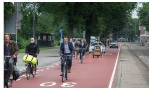
Referentiebeeld fietsstraat met auto te gast, Amsterdam