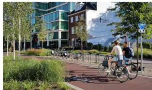
Referentiebeeld twee-richtingen fietspad, Vestdijk, Eindhoven